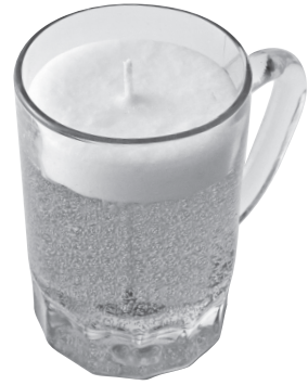
ビールジョッキキャンドル