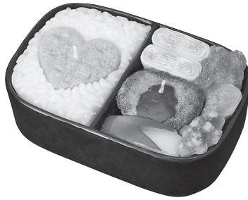
愛妻弁当キャンドル