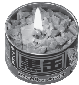
ミルキーの香りのミニ寸線香 ペットの好物「黒缶キャンドル」